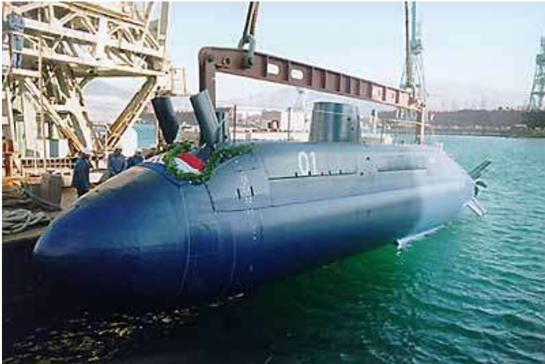
Slika 1 - Podmornica "Velebit"

Na površini od 34.000 m 2 BSO raspolaže proizvodnim kapacitetima za preuzimanje najsloženijih projekata.